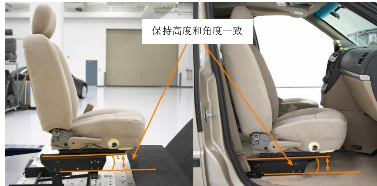
图5 座椅在车辆和台车上的安装

根据实车上测量的座椅安装固定点参数和样品尺寸，制作座椅工装，使车辆上座椅和地板的相对位置在台车上复现（见图5）。