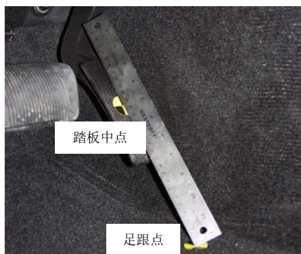
图 4 足跟点的确定（驾驶员侧）