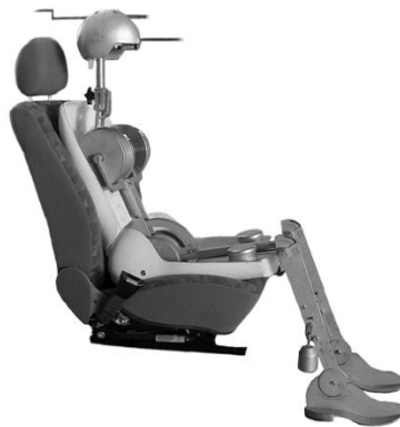
图 1 安装有头枕测量装置的 HPM

使用安装有 HRMD(见图 1)的 HPM 进行头枕高度和头后间隙测量。HPM 和 HRMD 装置需配套使用。